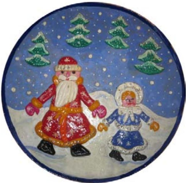
«Новогодняя сказка». Аппликация из теста. 5 класс. Руководитель – И.В.Рибнинова

Новый год! Сколько волнений, ожиданий он нам приносит. Дети знают, что на Новый год случаются разные чудеса и исполняются все желания, о которых они написали в своих письмах Деду Морозу и Снегурочке.