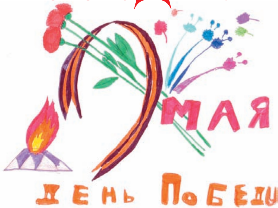
Рис. Шмелёвой Т., ученицы 5 класс