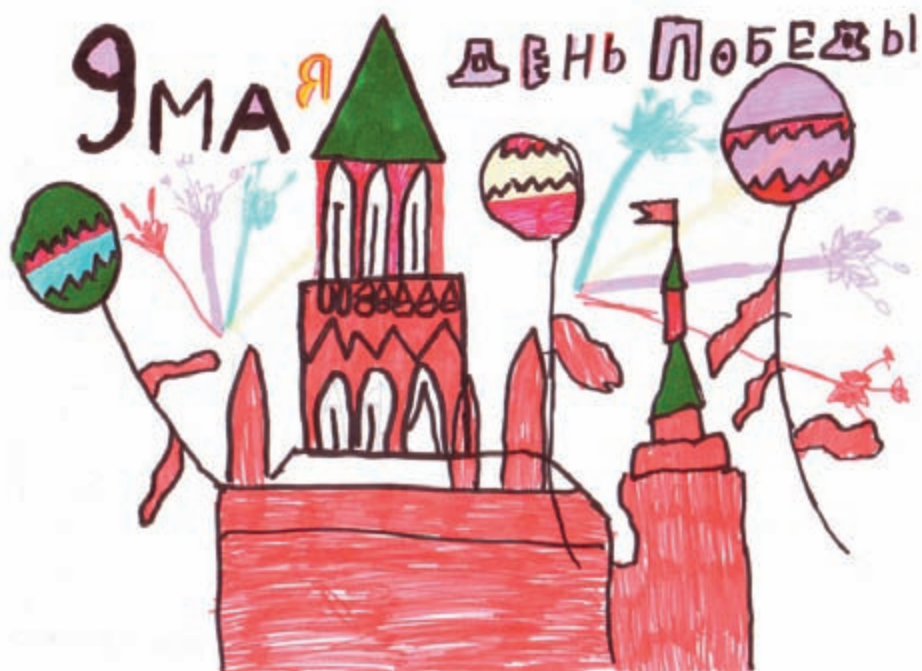
Рис. Баранникова Д., ученика 5 класса