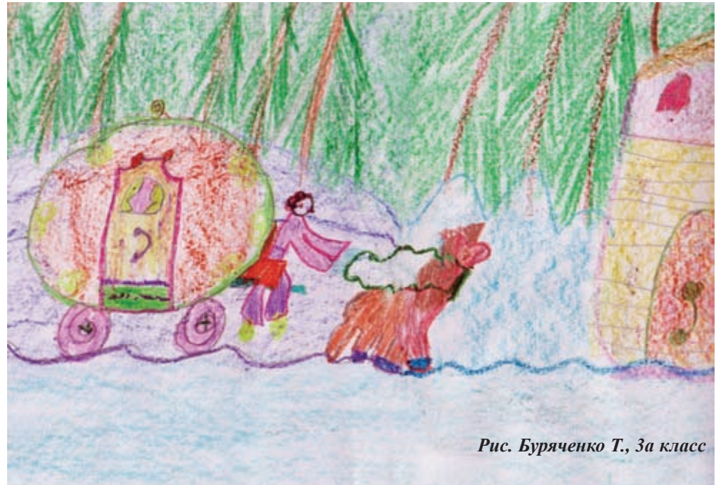
Рис. Буряченко Т., 3а класс

И опять пустилась в пляс! Только это не сейчас. А сейчас мне надо быстро мой дворец дорисовать. И идти на кухню к маме по хозяйству помогать. Но до этого успею вам совет хороший дать: Если будете мечтать, сможете, как я сегодня, Где хотите побывать.