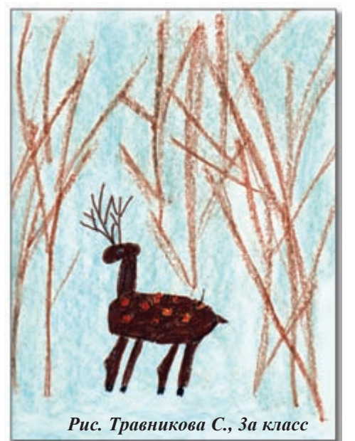
Рис. Травникова С., 3а класс

Спать улёгся наш Потапыч, с аппетитом сосёт лапу. Видит Миша сладкий сон: На полянке будто он. Будто солнечный денёк, будто сел он на пенёк. Перед ним бочонок с мёдом и малины кузовок.... Если встретишь ты берлогу на заснеженном пути, Обойди её стороной, Михаила не буди! До весны, Топтыгин, спи, сны волшебные смотри!