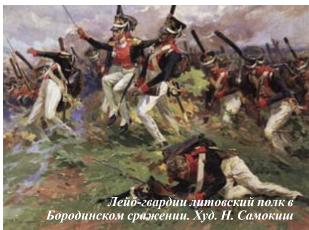
Лейб-гвардии литовский полк в Бородинском сражении. Худ. Н. Самокиш

Н.Н.Раевский, потому ее называют сейчас батареей Раевского. Левый фланг проходил близ деревни Семеновское. Здесь очень быстро были возведены укрепления — флеши, которые защищали солдаты генерала П.И.Багратиона (Багратионовы флеши). Деревня Бородино находилась между правым флангом и центром.