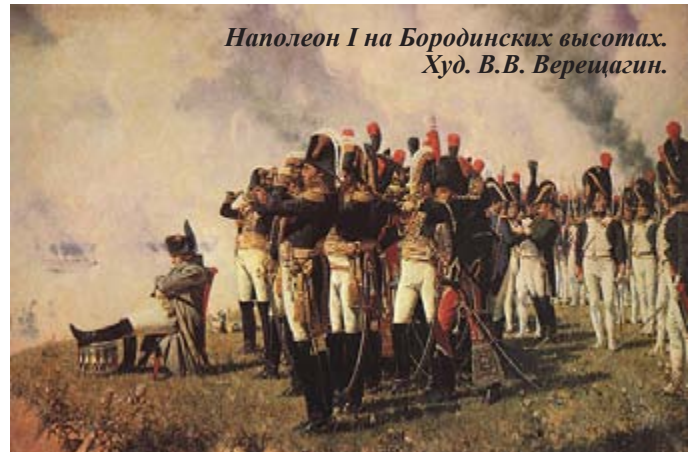
Наполеон I на Бородинских высотах. Худ. В.В. Верещагин.

Целый день продолжалась битва. Постепенно смолкли орудия. Страшную картину представляло собой Бородинское поле. Никогда еще завоеватели не видели такого большого количества убитых. Но, как и прежде, непоколебимо и грозно стояли русские полки. Они готовились к новому бою. Но, взвесив все «за» и «против», Кутузов приказал отступить к Москве. Французская армия была еще сильна.