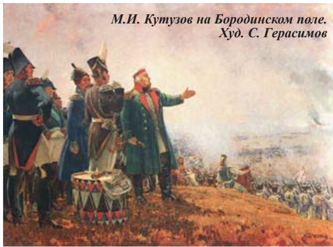
М.И. Кутузов на Бородинском поле. Худ. С. Герасимов

В этот день на Бородинском поле произошло генеральное сражение Отечественной войны 1812 г. против французских захватчиков. Император Франции Наполеон говорил незадолго до нападения на Россию: «Через три года я буду господином всего света. Остается Россия, но я раздавлю ее». Ровно через три года его империя была сокрушена, победоносные русские войска вошли в Париж, а сам он был отправлен пленником на далекий остров.