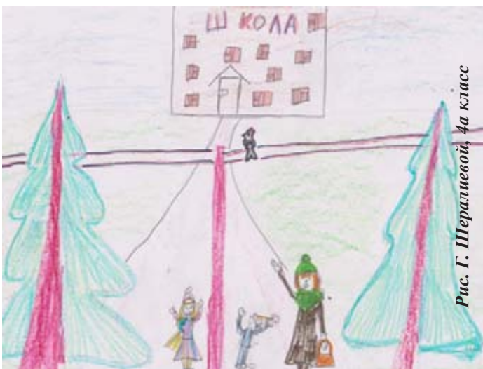
Рис. Г. Шералиевой, 4а класс

К концу зимы в лесу кончается корм для пернатых. Вот они и осмеливаются прилетать совсем близко к жилью человека, чтобы чем-нибудь поживиться. Хорошо, что наши ребята не забывают наполнять кормушки. А однажды к нам в гости пожаловал сам дятел. Время от времени он важно поглядывал с высоты электрического столба на удивлённых ребят и, совсем не смущаясь, продолжал свою работу.