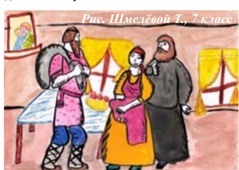
Рис. Шмелёвой Т., 7 класс

Ребята 7 класса иллюстрировали «Сказку о попе и его работнике Балде» А.С. Пушкина