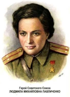
Герой Советского Союза ЛЮДИЛА МИХАЙЛОВНА ПАВЛИЧЕНКО

Первое боевое крещение девушка получила под Одессой. В одном из боёв убили ее командира взвода. Людмила на себя приняла командование. Она бросилась к пулемёту, однако рядом разорвался вражеский снаряд. Девушку контузило, но она не ушла в госпиталь, оставаясь в рядах защитников города.