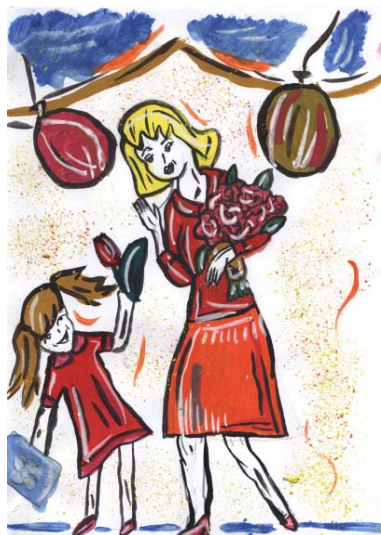
Рис. Шмелёвой Т., 8 класс