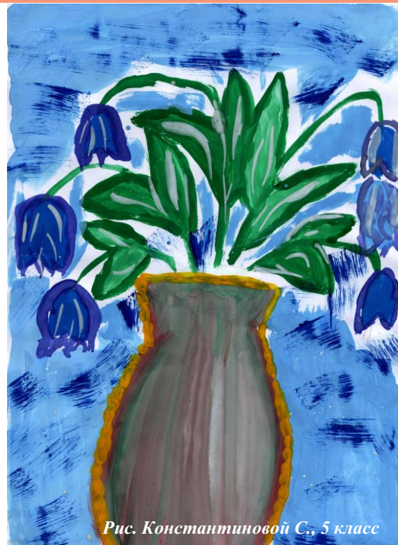
Рис. Константиновой С., 5 класс