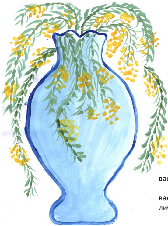
Рис. Комаровой Я., 7 класс

Дорогие женщины! От всей души поздравляем вас с первым весенним праздником!