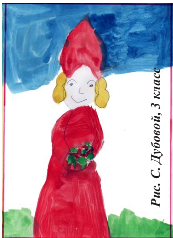
Рис. С. Дубовой, 3 класс