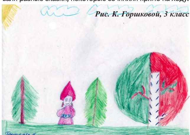
Рис. К. Горшковой, 3 класс

Осень подарила нам прекрасный солнечный денёк. Настроение у нас было радостное, подстать погоде. И вот мы словно попали в Сказочную страну. Нас встретила «Хозяйка» дендросада. Ребята поздоровались и попросили разрешения погулять по причудливым дорожкам сада. По дороге нам встретились и Дед Боровик, и Баба-Яга. Так мы и добрались до детской площадки, где нарядились в костюмы животных и показывали разные сказки, некоторые сочиняли прямо на ходу.