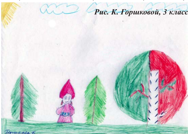
Рис. К. Горшковой, 3 класс

Осень подарила нам прекрасный солнечный денёк. Настроение у нас было радостное, подстать погоде. И вот мы словно попали в Сказочную страну. Нас встретила «Хозяйка» дендросада. Ребята поздоровались и попросили разрешения погулять по причудливым дорожкам сада. По дороге нам встретились и Дед Боровик, и Баба-Яга. Так мы и добрались до детской площадки, где нарядились в костюмы животных и показывали разные сказки, некоторые сочиняли прямо на ходу.