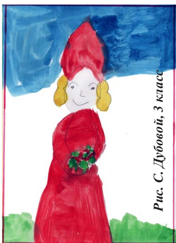
Рис. С. Дубовой, 3 класс