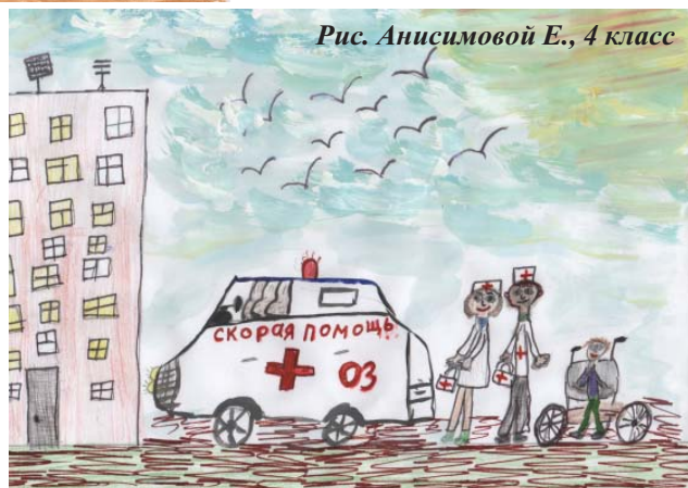
Рис. Анисимовой Е., 4 класс

Каждый день сажусь в кабину, Завожу мотор машины, Еду в дальние края. Отгадали, кто же я?