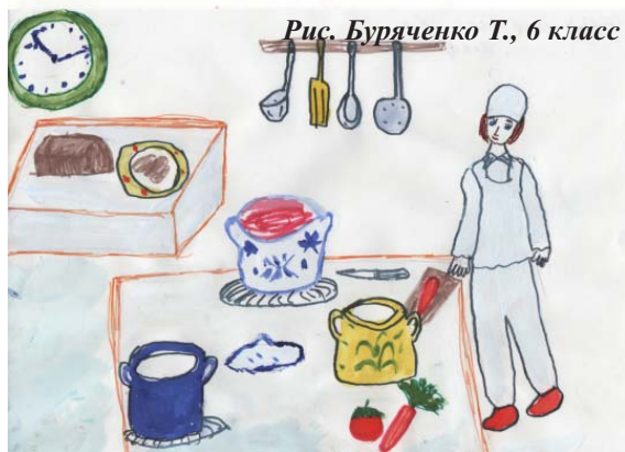
Рис. Бураченко Т., 6 класс

По квартирам и домам Много писем, телеграмм Он приносит адресатам. Как зовут его, ребята?