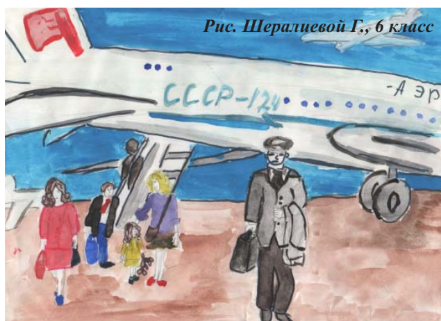
Рис. Шералиевой Г., 6 класс

Взрослея, человек узнает все больше, и его мечты меняются. В нашей школе прошла неделя труда. Ребята рассказывали про профессии своих