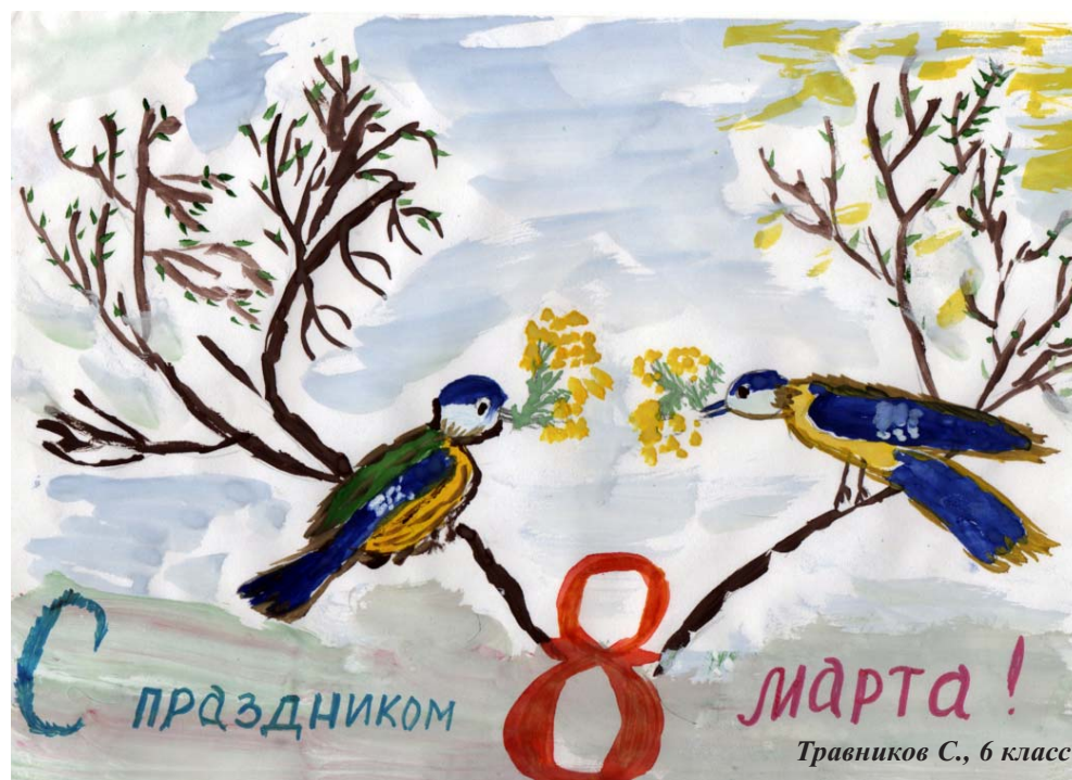
Травников С., 6 класс

Есть много праздников в стране, Но женский день отдан весне, Ведь только женщинам подвластно Создать весенний праздник лаской.