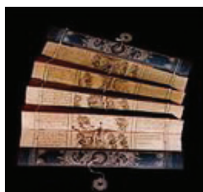
Индийская книга из пальмовых листьев