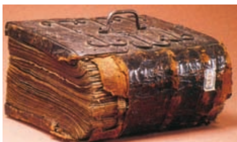
Книга из пергамента (кожи)

13 июня 2014 года Владимир Путин подписал указ о проведении Года литературы в России в 2015 году .