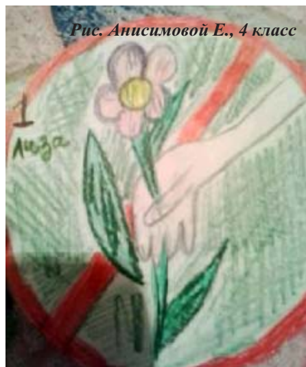
Рис. Анисимовой Е., 4 класс

Вот и прошла Неделя естественных наук. Каждому ребёнку 4 класса представилась возможность стать активным участником этой недели. Неделя началась с занятия «Будь природе другом!» Ребятам было предложено выбрать маршрут и совершить воображаемое путешествие по экологической тропе. Они вспомнили правила поведения в природе, разгадывали кроссворды. Придумали несколько простых правил и назвали их «Правила друзей природы». К этим правилам придумали и нарисовали знаки.