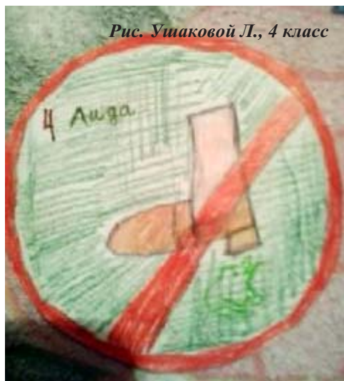
Рис. Ушаковой Л., 4 класс