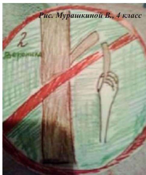
Рис. Мурашкиной В., 4 класс