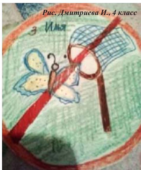
Рис. Дмитриева И., 4 класс