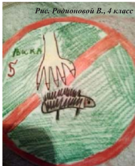
Рис. Родионовой В., 4 класс