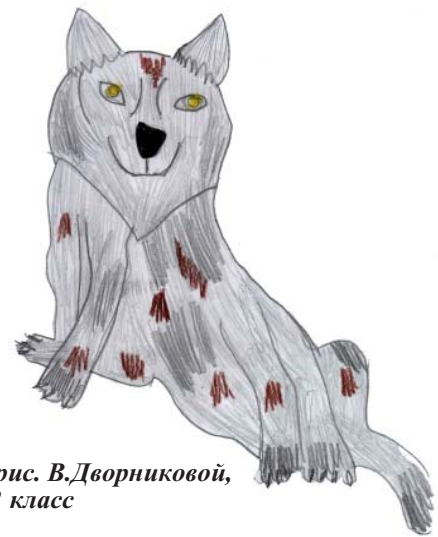
рис. В.Дворниковой, 2 класс

Тогда было решено охотиться на волка с вертолёта. Вооружившись ружьями, охотники начали преследование. А он, как стрела мчался по степи. Мчался во весь дух, отчаянно надеясь спасти свою волчью жизнь (может быть ради маленьких волчат, что ждали его родном логове). Благодаря оптическим прицелам нетрудно было его рассмотреть. Вот он. Весь как на ладони. Зверь просто на загляденье. Крупный, сантиметров девяносто в холке, сам серый с рыжими подпалинами. Не успели охотники взвести курки, как вдруг исчез наш Серый! Ну как сквозь землю провалился! Нет его нигде, только