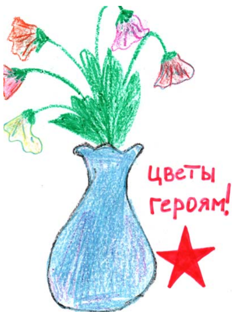
Рис. Т.Буряченко, 6 класс

Силами педагогов и учеников нашей школы подготовлен альманах «Семейные военные хроники», который выпущен в честь празднования 70-летия Победы в Великой Отечественной войне 1941-1945 годов. Альманах будет опубликован на школьном сайте.