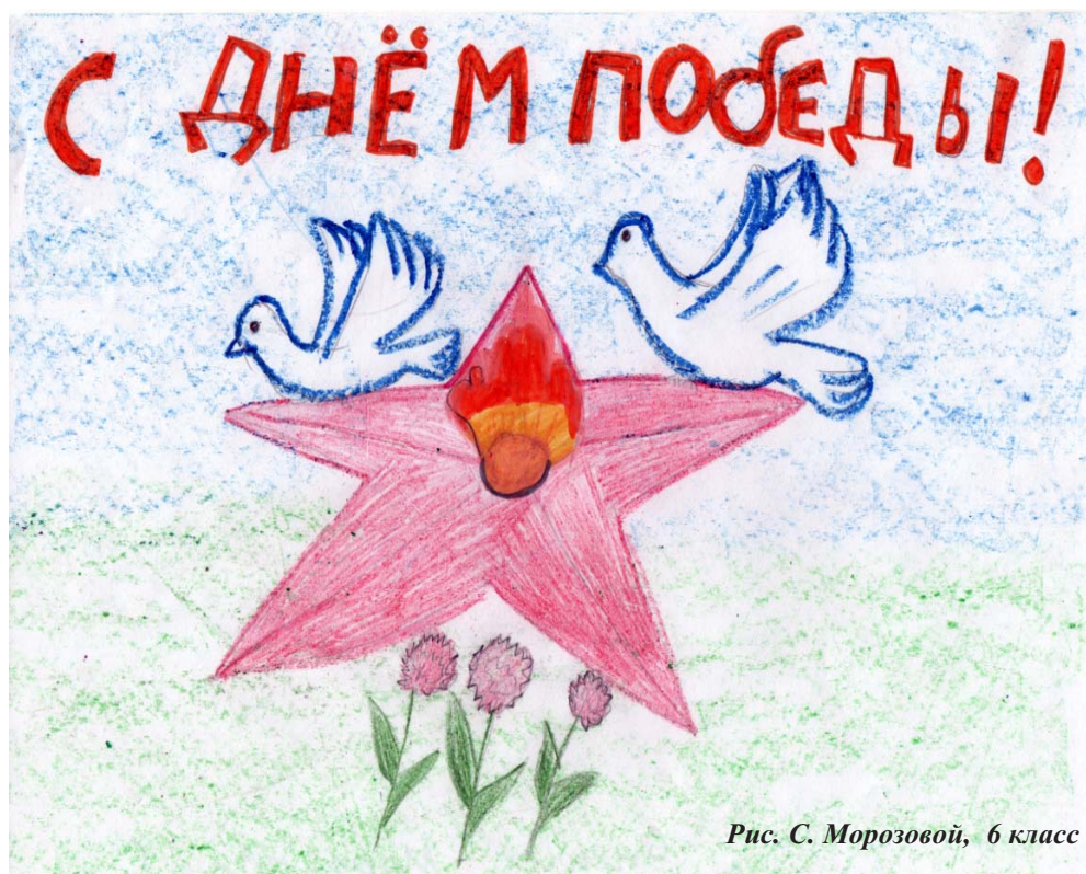
Рис. С. Морозовой, 6 класс

А мы с тобой, брат, из пехоты; А летом лучше, чем зимой. С войной покончили мы счеты... Бери шинель, пошли домой! Война нас гнула и косила. Пришел конец и ей самой. Четыре года мать без сына — Бери шинель, пошли домой. К золе и пеплу наших улиц Опять, опять, товарищ мой, Скворцы пропавшие вернулись — Бери шинель, пошли домой. А ты с закрытыми очами Спишь под фанерною звездой. Вставай, вставай, однополчанин, — Бери шинель, пошли домой. Что я скажу твоим домашним, Как встану я перед вдовой? Неужто клясться днем вчерашним, — Бери шинель, пошли домой. Мы все — войны шальные дети, И генерал, и рядовой Опять весна на белом свете — Бери шинель, пошли домой.