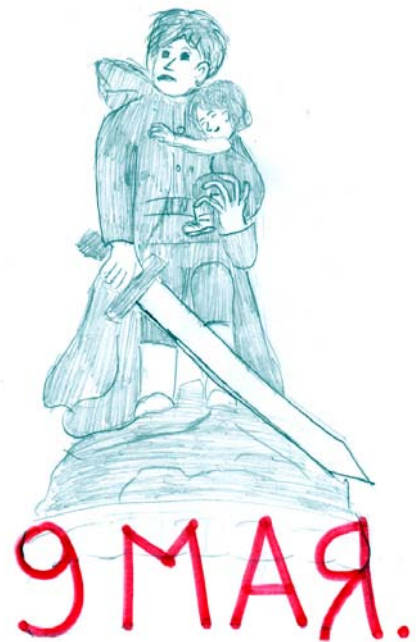
Рис. Г. Шералиевой, 6 класс

Силами педагогов и учеников нашей школы подготовлен альманах «Семейные военные хроники», который выпущен в честь празднования 70-летия Победы в Великой Отечественной войне 1941-1945 годов. Альманах будет опубликован на школьном сайте.