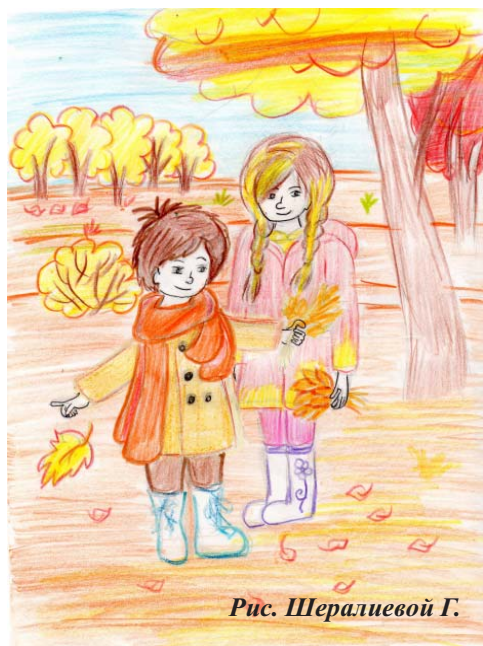
Рис. Шералиевой Г.

С уважением и благодарностью учителя Вашей школы!