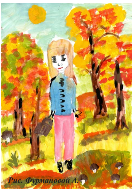
Рис. Фурмановой А.