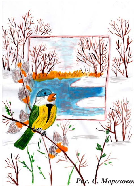
Рис. С. Морозовой

Уважаемая Татьяна Михайловна! Коллектив учителей поздравляет Вас с 8 Марта!