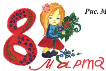
Рис. М. Джурич

Т.В. Шелемотова, классный руководитель 9 класса