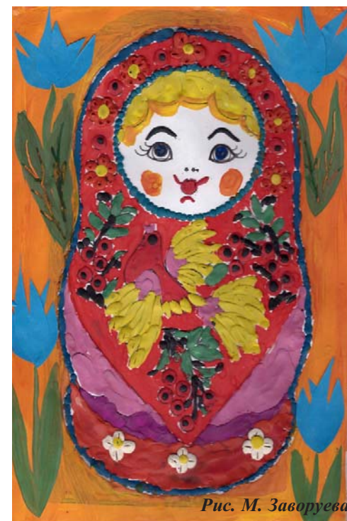
Рис. М. Заворуева