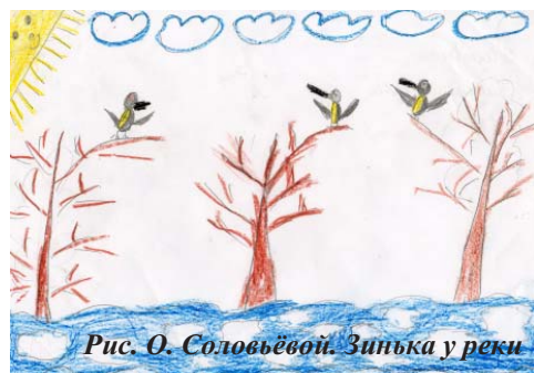
Рис. О. Соловьёвой. Зинька у реки.

По душе пришлись ребятам приключения весёлой непоседы-синички по имени Зинька, старого мудрого Воробья, птички Ледоломки, добрых и миролюбивых курапаток и других героев. С удовольствием ребята рисовали персонажей сказок,