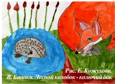
Рис. Е. Кожухова. В. Бианки. Лесной колобок - колочий бок.

мастерили аппликации, лепили. И не переставали удивляться: оказывается, все взаимосвязано в природе, всё мудро устроено! Так полюбили ребята эти необыкновенные, светлые, добрые сказки, что было решено не расставаться с ними, с их замечательными героями. Советуем и вам, ребята, обязательно почитать сказки или рассказы Виталия Бианки. И вы научитесь бережно относиться к природе, познаете многие её секреты и законы.