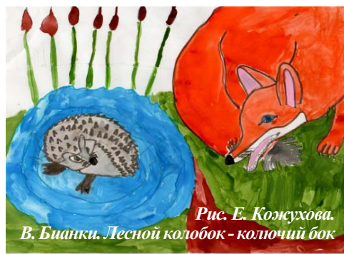
Рис. Е. Кожухова. В. Бианки. Лесной колобок - колочий бок.

мастерили аппликации, лепили. И не переставали удивляться: оказывается, все взаимосвязано в природе, всё мудро устроено! Так полюбили ребята эти необыкновенные, светлые, добрые сказки, что было решено не расставаться с ними, с их замечательными героями. Советуем и вам, ребята, обязательно почитать сказки или рассказы Виталия Бианки. И вы научитесь бережно относиться к природе, познаете многие её секреты и законы.