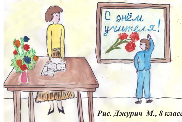
Рис. Джурич М., 8 класс