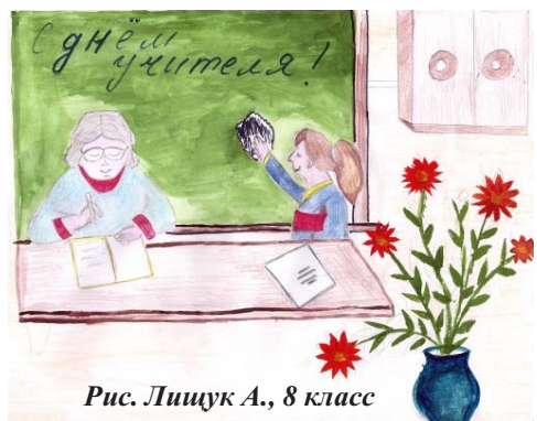
Рис. Лицук А., 8 класс