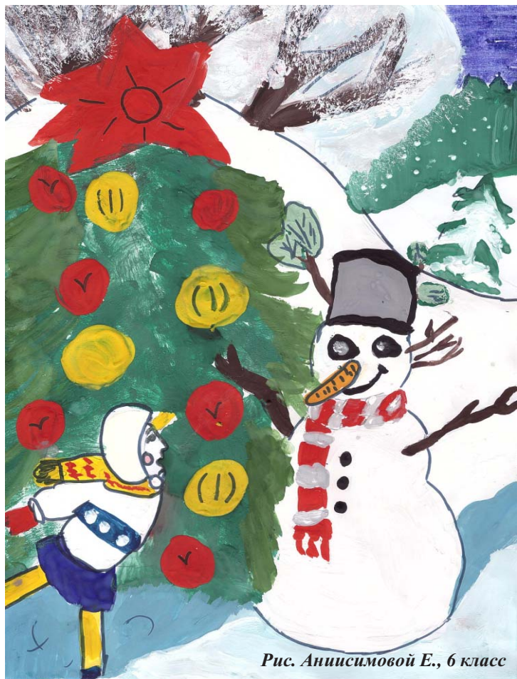
Рис. Анисимовой Е., 6 класс