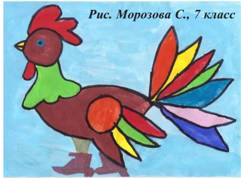
Рис. Морозова С., 7 класс