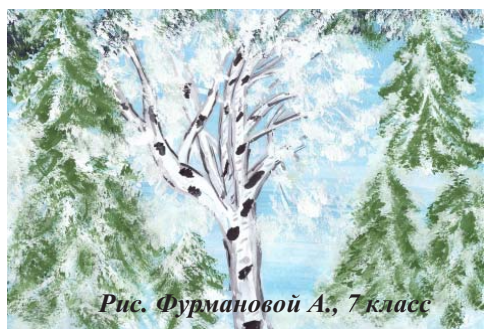
Рис. Фурмановой А., 7 класс