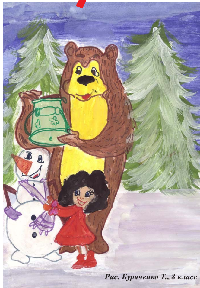
Рис. Бураченко Т., 8 класс

Кажется совсем недавно прозвенел звонок на первый урок, а на дворе уже зима, Новый год. Шестиклассники это время провели с пользой, очень интересно, так как у всех были занятия по душе.