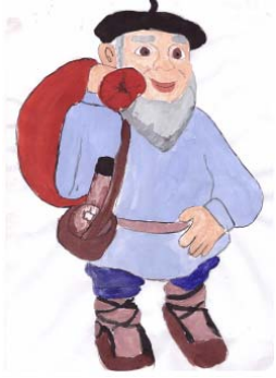
Рис. Востряковой А., 8 класс

В Швеции перед Новым годом дети выбирают королеву света - Люцию. Её наряжают в белое платье, на голову надевают корону с зажженными свечами. А настоящая Люция приносит ночью подарки детям и лакомства домашним животным: кошке - сливки, собаке - сахарную косточку, ослику - морковку.