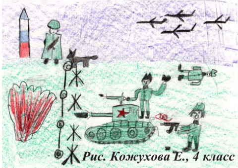
Рис. Кожухова Е., 4 класс

На посту будет стоять И Отчизну охранять На дозоре не со мной Этот пёс сторожевой.