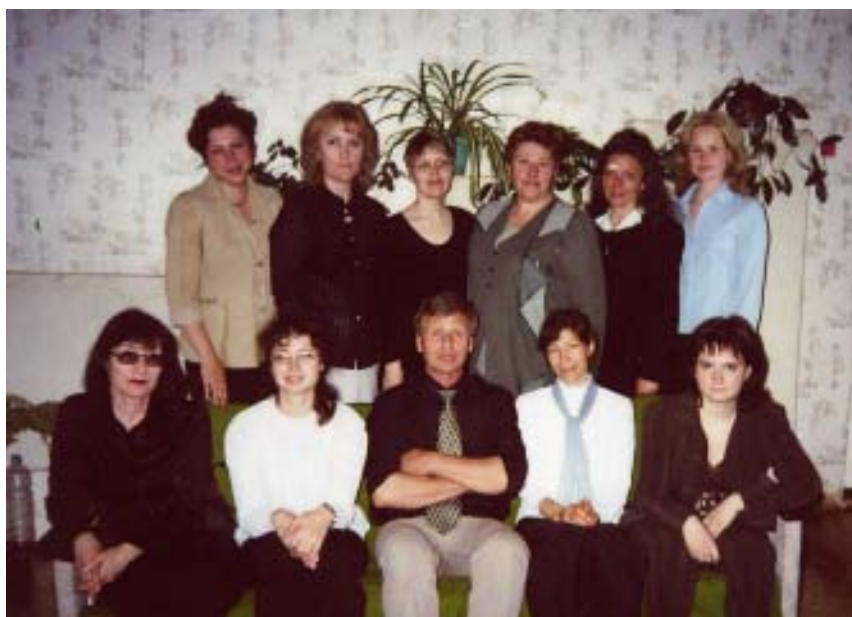
Педагоги СКШИ после праздника Последнего звонка, 2004 год

Вы — великие таланты, Но понятны и просты. Вам — сегодня все подарки! Вам — все песни и цветы!