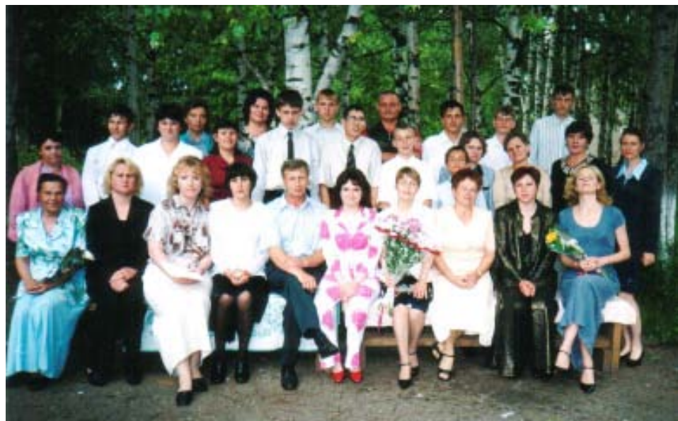
Вот такими были выпускники 2004 года в день окончания школы. Часть из них продолжает обучение в 10 классе, остальные осваиваются в новых условиях жизни.

Хочется пожелать педагогам, родителям, детям беречь друг друга, заботиться не только о физическом, но и нравственном здоровье, активно преодолевать трудности, работать и учиться с радостью.