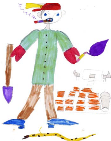
Рис. Бондаренко А.