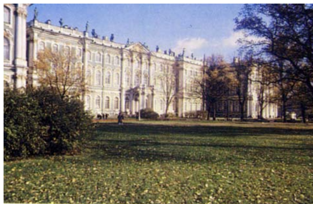
Зимний дворец в Санкт-Петербурге. Архитектор В.В. Растрелли

Грациозная, всегда со вкусом одетая и остроумная, Елизавета блистала на балах и празднествах, и была душой общества. Всё для неё складывалось хорошо до смерти матери, Екатерины I. После Екатерины на российский престол взошла Анна Иоанновна, которая недолго любила Елизавету, так как видела в ней соперницу, и даже хотела заточить её в монастырь. Но Елизавета Петровна вела себя осторожно, дипломатично. За свой лёгкий нрав она зас-