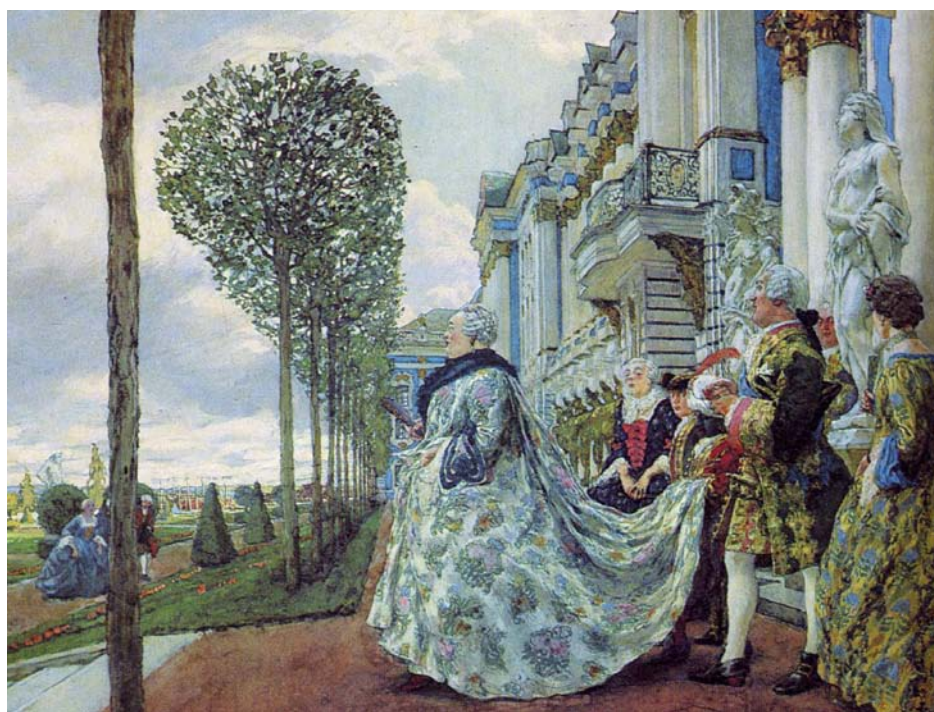
Е. Лансере. Императрица Елизавета Петровна в Царском Селе

Елизавета Петровна, дочь Петра I, родилась 18 декабря 1709 года. В этот момент её мать, Екатерина, ещё не состояла в браке с императором. Родители венчались, когда Елизавете исполнилось два года. Она рано обучилась грамоте, знала французский, немецкий и итальянский языки. Елизавета прекрасно танцевала, увлекалась пением, сочиняла стихи и песни. Она обладала несомненным вкусом, её наряды всегда были элегантны.