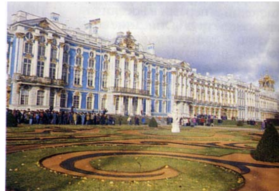
Большой Царскосельский дворец. Архитектор В.В. Растрелли

Елизавета обладала непростым, противоречивым характером. Лёгкая на подъём, она любила путешествовать. Она часто неожиданно уезжала из Петербурга, посещала многие храмы, которым оставляла богатые вклады, предпринимала пешие походы по святым местам. Но такие походы больше походили на увеселительные прогулки, которые иногда длились не один месяц. Пройдя пешком