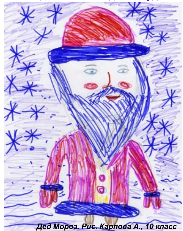
Дед Мороз. Рис. Карпова А., 10 класс

Новый год — наш любимый праздник. Мы ждём веселья и исполнения желаний.