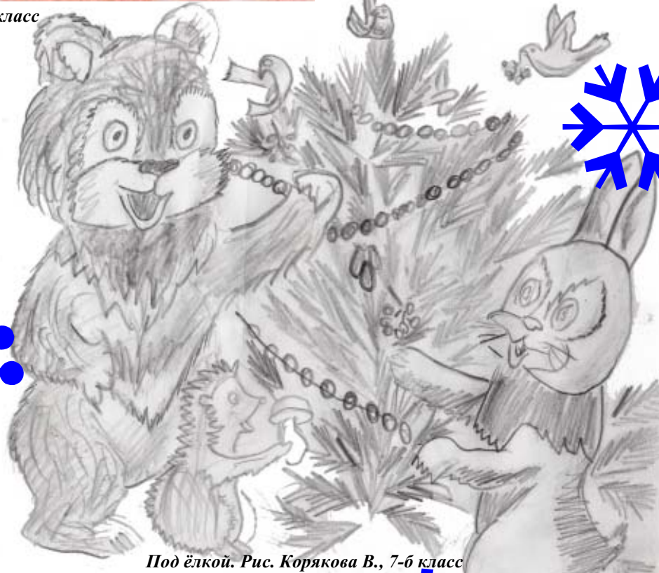
Под ёлкой. Рис. Корякова В., 7-б класс