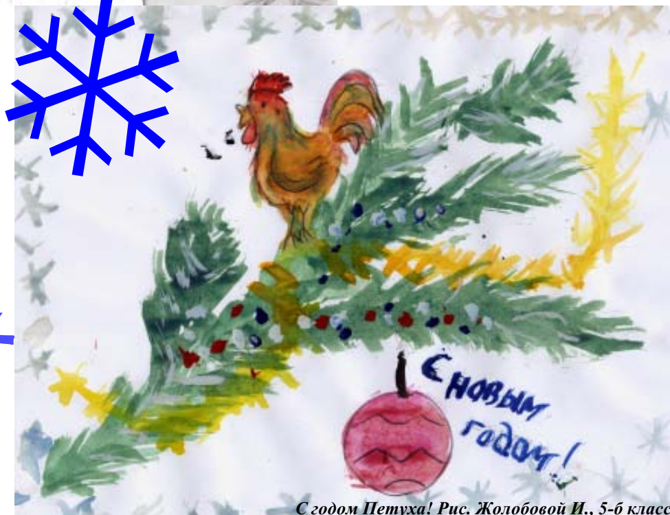
С годом Петуха! Рис. Жолобовой И., 5-б класс

Счастливого, веселого Нового года желаю всем учителям, воспитателям, врачам, медсестрам, завхозам, техническим служащим!