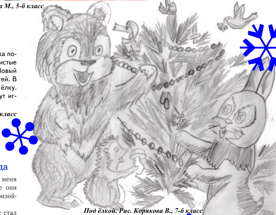
Под ёлкой. Рис. Корякова В., 7-б класс