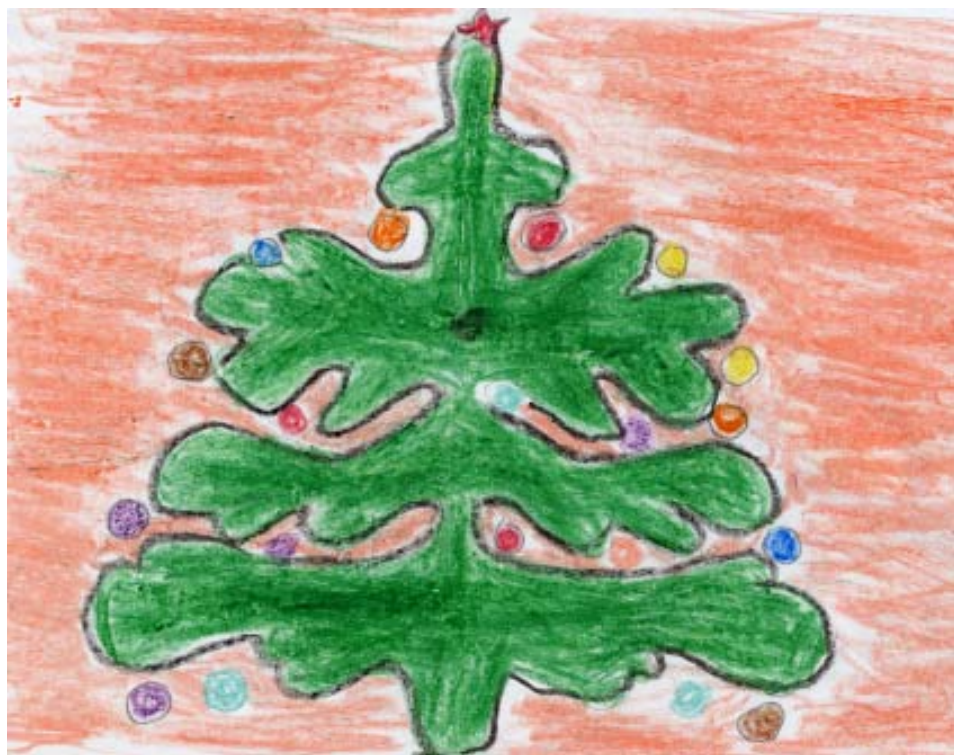
Новогодняя ёлка. Рис. Строчнева М., 5-б класс