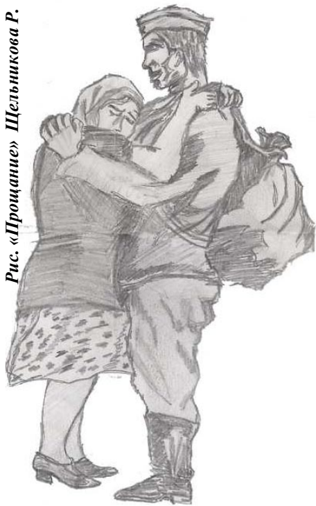
Рис. «Прощание» Шельникова Р.

Читая художественные произведения, документальные очерки, мы узнаём о простых людях, благодаря которым была побеждена гитлеровская Германия, подвергнута резкому осуждению не только действия, но и идеи фашизма.