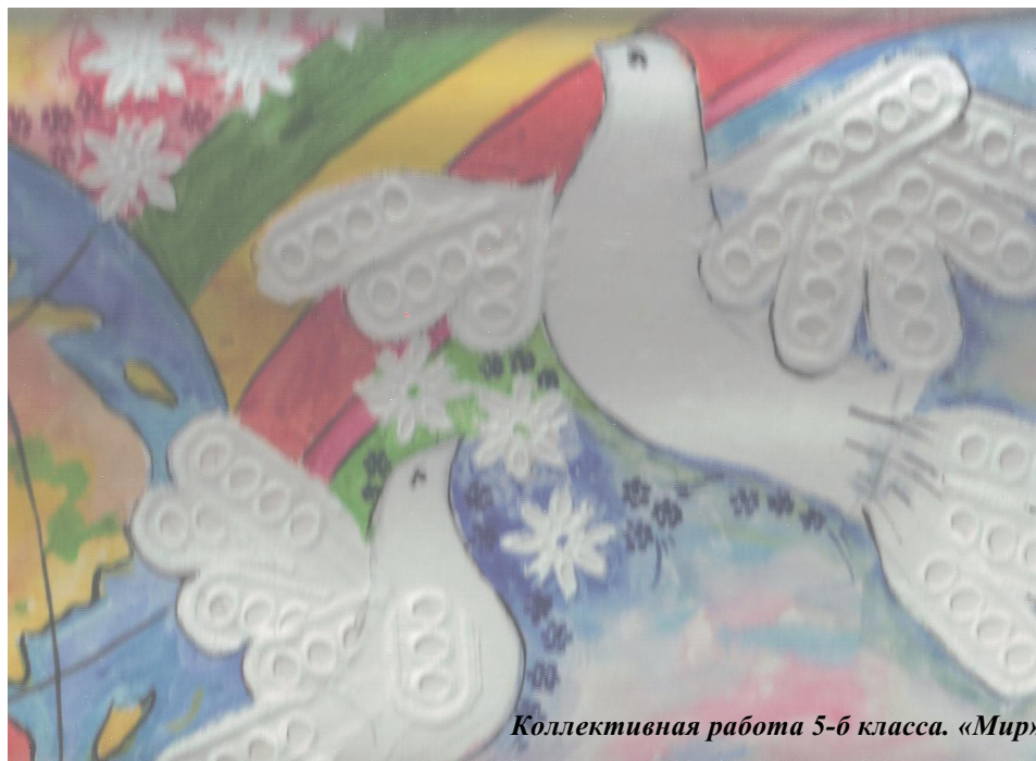
Коллективная работа 5-б класса. «Мир»