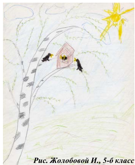
Рис. Жолобовой И., 5-6 класс