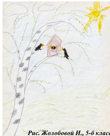
Рис. Жолобовой И., 5-6 класс