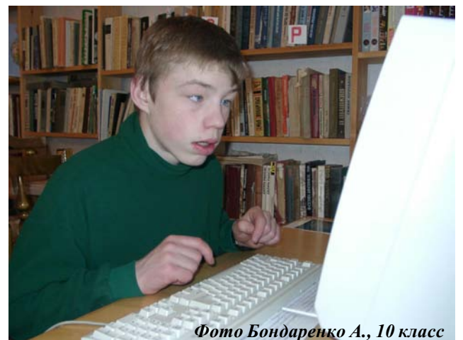
Фото Бондаренко А., 10 класс