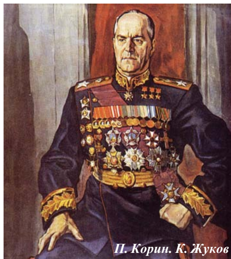
П. Корин. К. Жуков