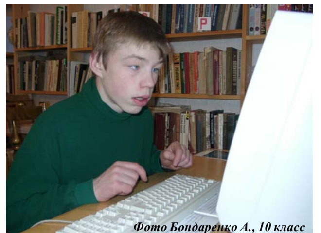
Фото Бондаренко А., 10 класс