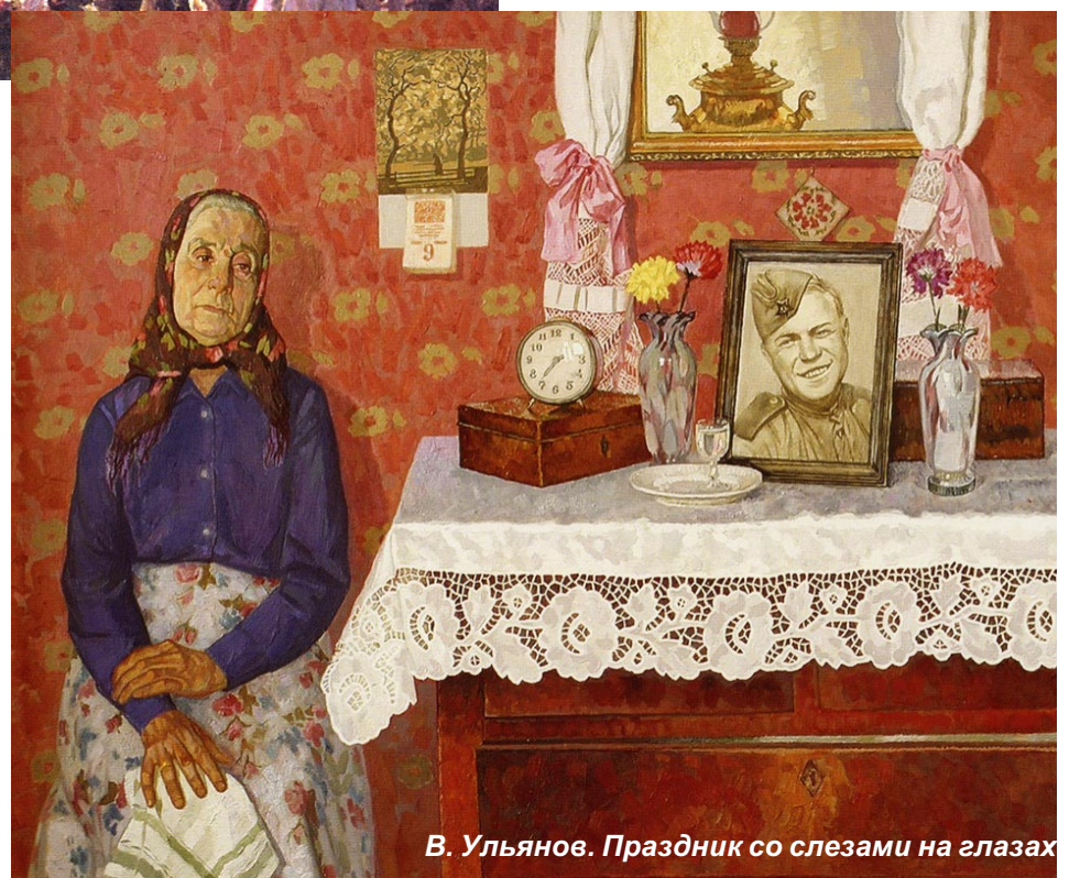
В. Ульянов. Праздник со слезами на глазах

Родина, суровая и милая, Помнит все жестокие бои. Вырастают рощи над могилами, Славят жизнь ночами соловьи.