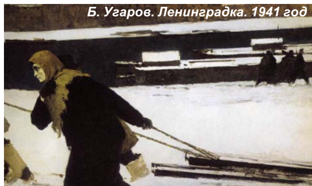
Б. Угаров. Ленинградка. 1941 год

Люди страдали от голода и холода, бомбёжек и артобстрелов, но не сдавались. Работали. Многие ленинградцы погибли в осаждённом городе. Их тела захоронены в братских могилах Пискаревского кладбища.