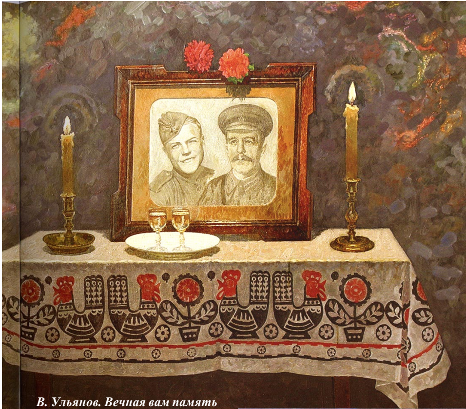
В. Ульянов. Вечная вам память

Нас не нужно жалеть, ведь и мы б никого не жалели. Мы пред нашим комбатом, как пред Господом Богом, чисты. На живых порыжели от крови и глины шинели, На могилах у мёртвых расцвели голубые цветы... Расцвели и опали... Проходит за осенью осень. Наши матери плачут, и ровесницы молча грустят. Мы не знали любви, не изведали счастья ремёсел, Нам досталась на долю нелёгкая участь солдат. Это наша судьба, это с ней мы ругались и пели, Поднимались в атаку и рвали над Бугом мосты... Нас не нужно жалеть: ведь и мы б никого не жалели, Мы пред нашей Россией и в трудное время чисты.