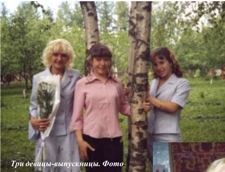
Три девицы-выпускницы. Фото