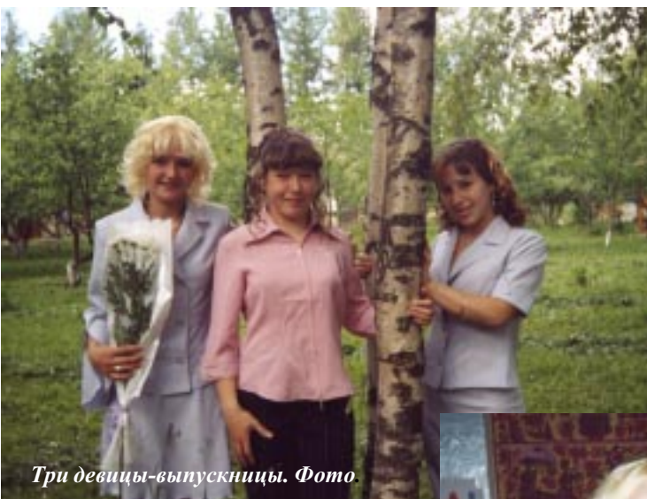
Три девицы-выпускницы. Фото