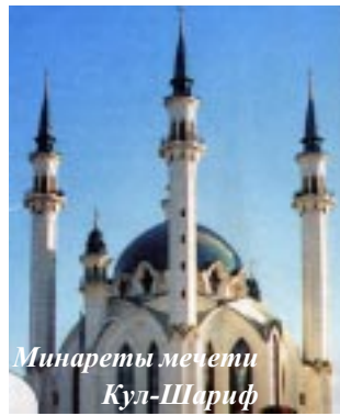
Минареты мечети Кул-Шариф