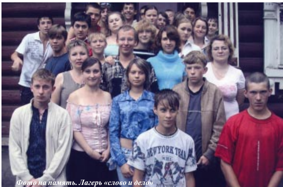
Фото на память. Лагерь «слово и дело»