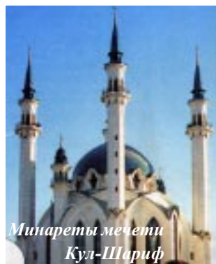
Минареты мечети Кул-Шариф