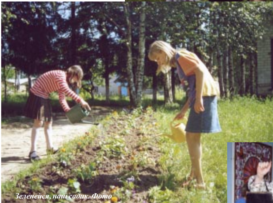
Зеленейся, наш садик. Фото