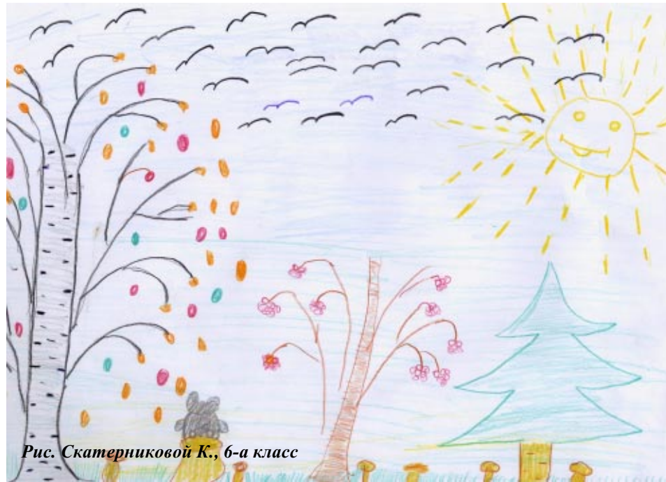
Рис. Скатерниковой К., 6-а класс