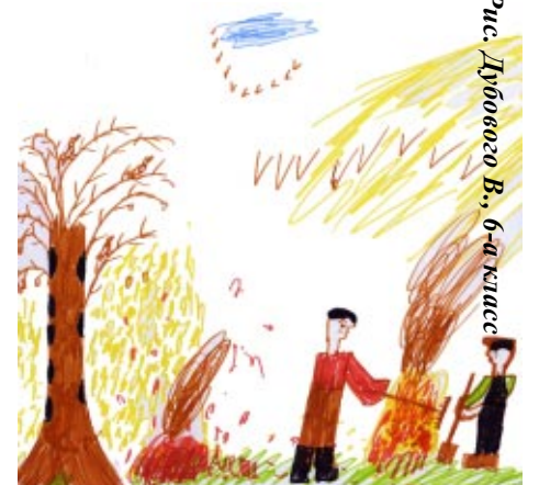
Рис. Дубового В., 6-а класс

— Много работы требуют школьный сад и двор. Все классы трудятся на уборке опадающей листвы.