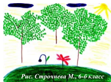
Рис. Строчнева М., 6-б класс

Вот и кончилось беззаботное лето. Оно нас радовало тёплыми днями, весёлыми каникулами, цветами, ягодами. Мы и не заметили, как наступили первые дни осени.