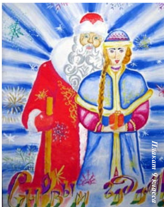
Пискарт 9 летисса