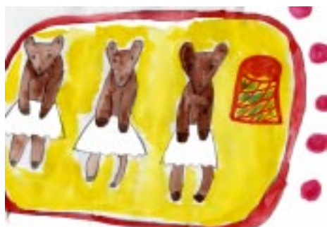
Рис. «Танец маленьких лебедей», Воробьёв Е., 5б класс

Ребята стали свидетелями сказочных приключений. Снегурочки и Деда Мороза. Не обошлось и без козней Бабы Яги и Лешего. Сюжет новогодней сказки переплетался цир-