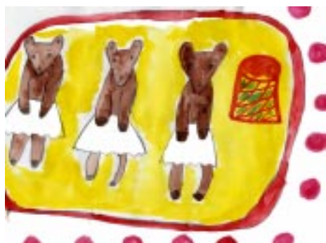
Рис. «Танец маленьких лебедей», Воробьёв Е., 5б класс

Ребята стали свидетелями сказочных приключений. Снегурочки и Деда Мороза. Не обошлось и без козней Бабы Яги и Лешего. Сюжет новогодней сказки переплетался цир-