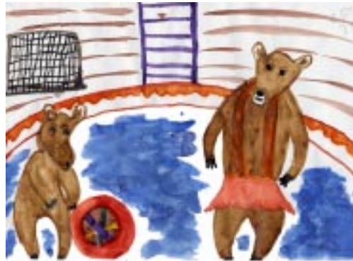
Рис. «Медведи-футболисты», Родионов С., 8 класс

ки, четвёрка бурых медведей в балетных пачках исполнили танец «маленьких лебедей». Мишки-танцоры оказались ещё и азартными футболистами, а медведь-вратарь не пропустил ни одного гола.