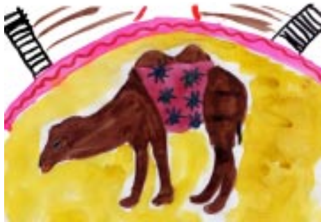
Рис. «Верблюд», Яковлева А., 4 класс Ретель не только арену, но и музыкантов оркестра в торжественных чёрных фраках, их инструменты, начищенные до блеска, можно было наблюдать за работой осветителей.

Сверканием разноцветных огней встречала Новогодняя ёлка ребят нашей школы у парадного входа в Ярославский цирк. А в вестибюле царственно возлежал на большом бордовом ковре дрессированный верблюд. Он великодушно позволял всем желающим сфотографироваться вместе с собой. А вокруг — радостные улыбки, шутки, смех! Всё предвещало необыкновенный праздник. Звуки живой музыки духового оркестра возвестили о начале представления. Ребята заняли свои места. Места оказались очень удобными: сверху легко можно было рассмотреть