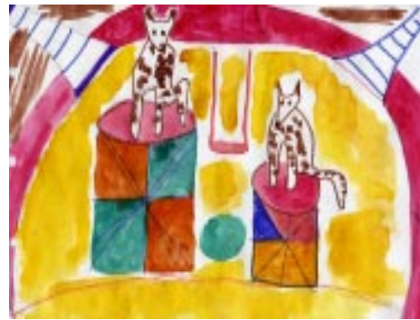
Рис. «Артисты-далматинцы», Кудрин И., 5а класс

Ребята стали свидетелями сказочных приключений. Снегурочки и Деда Мороза. Не обошлось и без козней Бабы Яги и Лешего. Сюжет новогодней сказки переплетался цир-