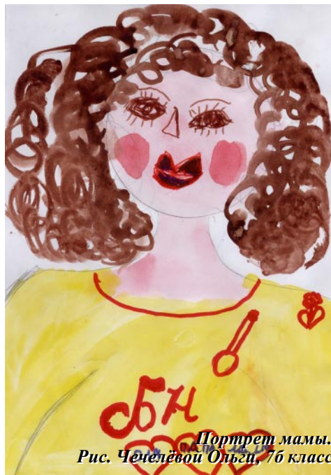
Портрет мамы. Рис. Чепелёвой Ольги, 7б класс

Лучший подарок для мамы тот, который сделан руками её детей: рисунок, вышивка, мягкая игрушка. Наши ученики с увлечением рисуют для своих мам.