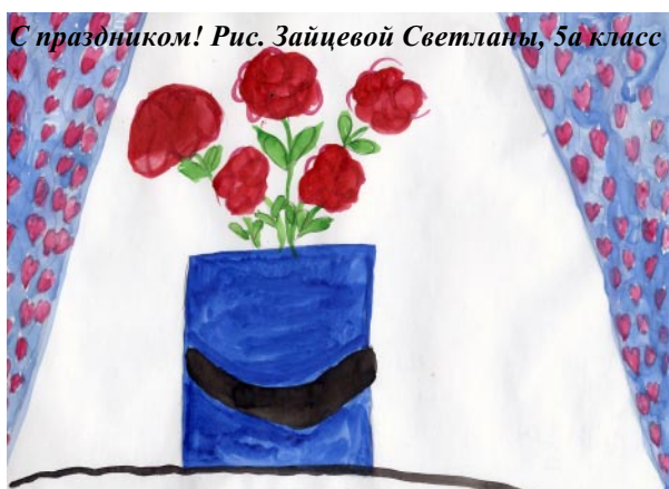
С праздником! Рис. Зайцевой Светланы, 5а класс