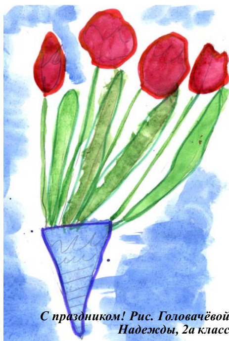
С праздником! Рис. Головачёвой Надежды, 2а класс

Лучший подарок для мамы тот, который сделан руками её детей: рисунок, вышивка, мягкая игрушка. Наши ученики с увлечением рисуют для своих мам.