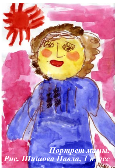
Портрет мамы. Рис. Шишова Павла, 1 класс