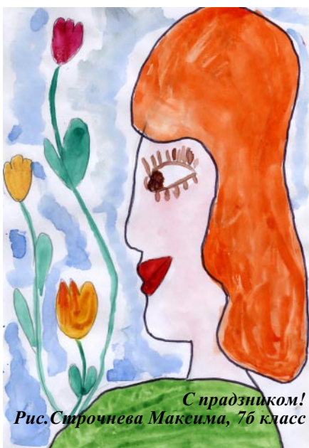
С праздником! Рис. Сирочнева Максима, 7б класс

Если вас нет дома, то в нём пусто, серо, одиноко и скучно. При вас в доме вкусно пахнет, звучат радостные песни, оживают добрые сказочные герои. Хочется прыгать, кувыркаться, петь и танцевать. Хочет крикнуть на весь белый свет: «Вот моя мамочка! Она лучше всех на свете!»