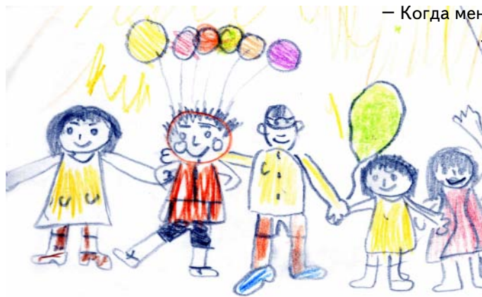
Коллективный рисунок «Мы»

Это заметки психологического занятия, на котором пятиклассники обсуждали вопросы взаимоотношений и дружбы. Получилось небольшое коллективное сочинение, которое, наверное, поможет и другим ребятам задуматься о тех обидах, которые портят человеческие отношения.