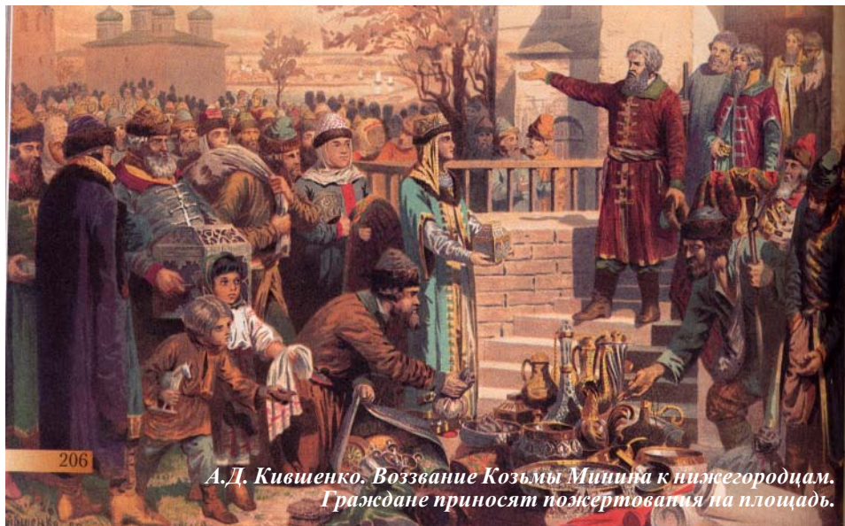
А.Д. Кившенко. Воззвание Козьмы Минина к нижегородцам. Граждане приносят пожертвования на площадь.

В богатом Нижнем Новгороде был объявлен сбор денег на снаряжение войска. Пример другим подал купец Кузьма Минин.