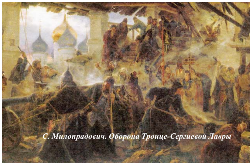
С. Милопрадович. Оборона Троице-Сергиевой Лавры

Лжедмитрий II с лёгкостью захватывал русские города и деревни, осадил он и Троице-Сергиев монастырь, оборона которого длилась шестнадцать месяцев. Ни приступами, ни измором не удалось осаждающим одолеть мужественных защитников, которые у гроба Святого Сергия Радонежского покаялись, что будут стоять на смерть, но врагу не сдадутся.