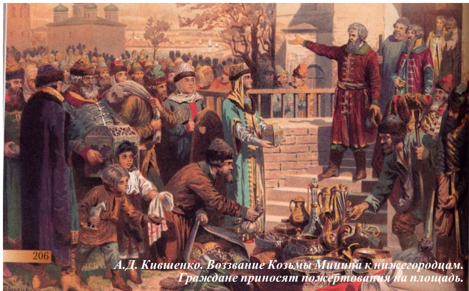
А.Д. Кившенко. Воззвание Козьмы Минина к нижегородцам. Граждане приносят пожертвования на площадь.

В богатом Нижнем Новгороде был объявлен сбор денег на снаряжение войска. Пример другим подал купец Кузьма Минин.