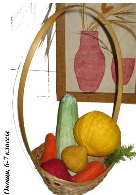
Овощи, 6-7 классы