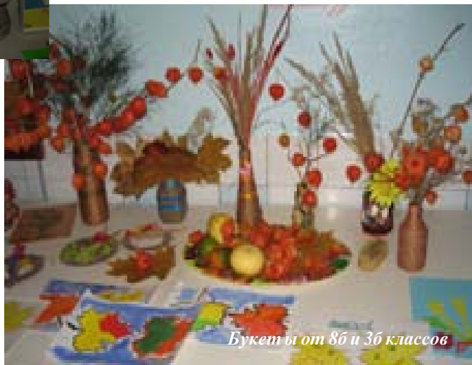
Букеты от 8б и 3б классов