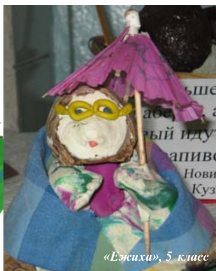
«Ежиха», 5 класс