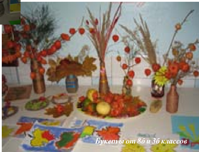
Букеты от 8б и 3б классов

14 ноября в школе прошёл праздник Осени. Долго и старательно готовились ребята и взрослые к празднику. Умение и фантазию проявили все учащиеся при изготовлении поделок.