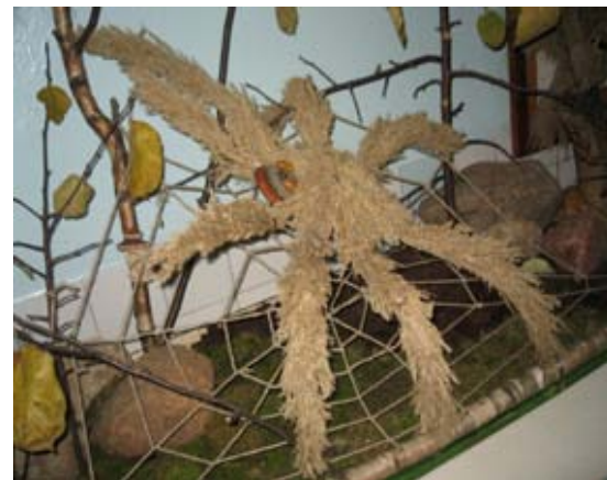
Паук, 8-9 классы