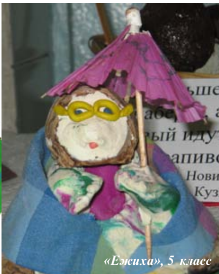
«Ежиха», 5 класс