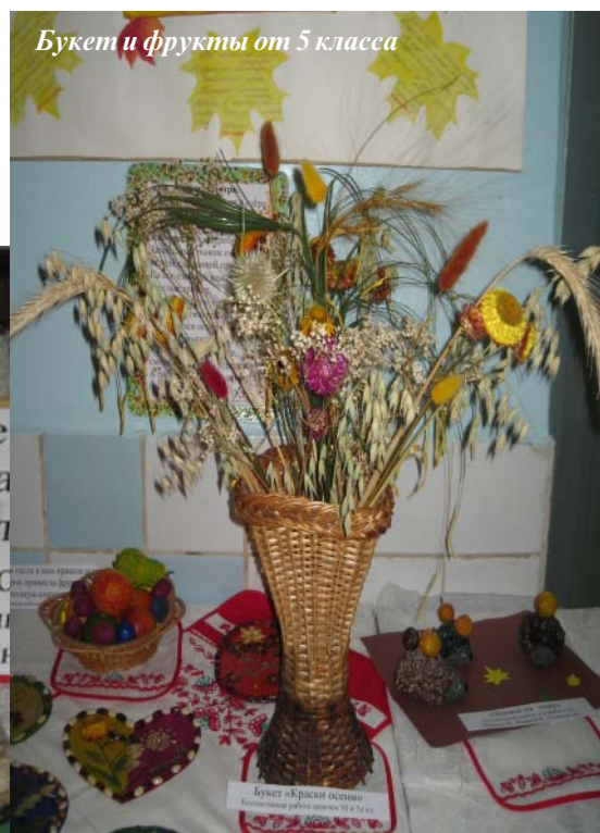
Букет и фрукты от 5 класса