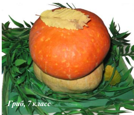
Гриб, 7 класс