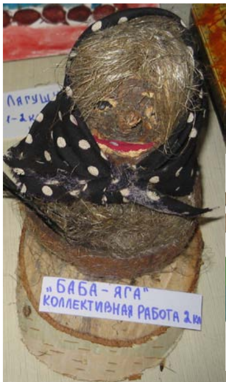
«БАБА-ЯГА» КОЛЛЕКТИВНАЯ РАБОТА 2.кв