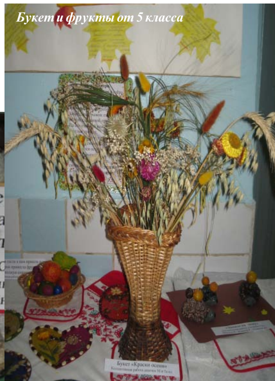
Букет и фрукты от 5 класса