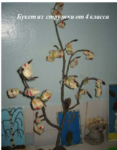
Букет из стружки от 4 класса