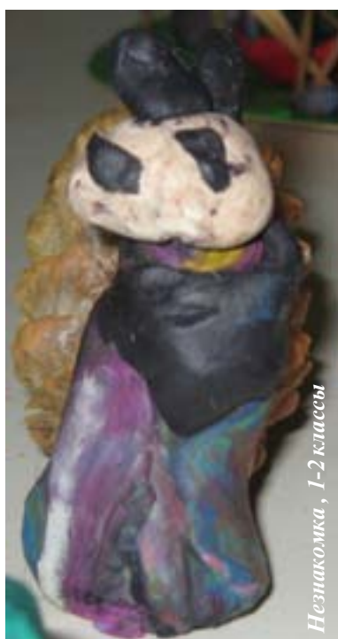
Незнайка, 1-2 классы