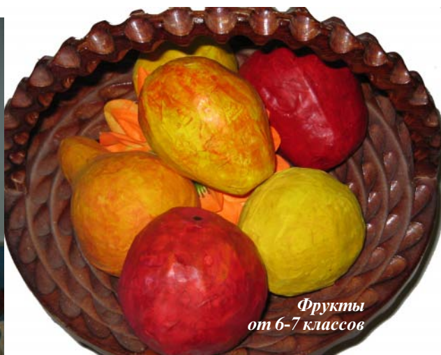
Фрукты от 6-7 классов