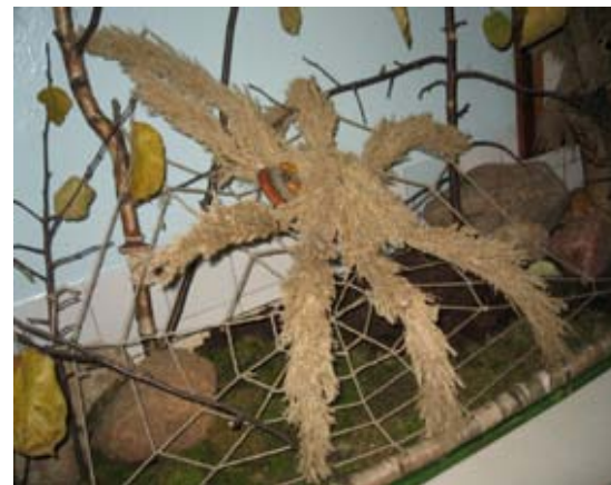
Паук, 8-9 классы

14 ноября в школе прошёл праздник Осени. Долго и старательно готовились ребята и взрослые к празднику. Умение и фантазию проявили все учащиеся при изготовлении поделок.