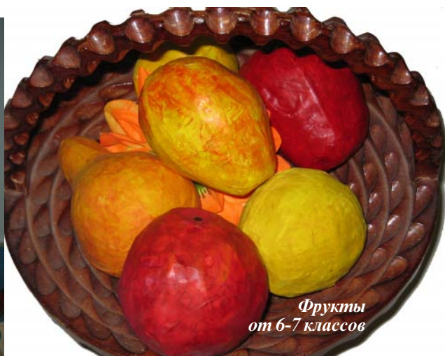
Фрукты от 6-7 классов