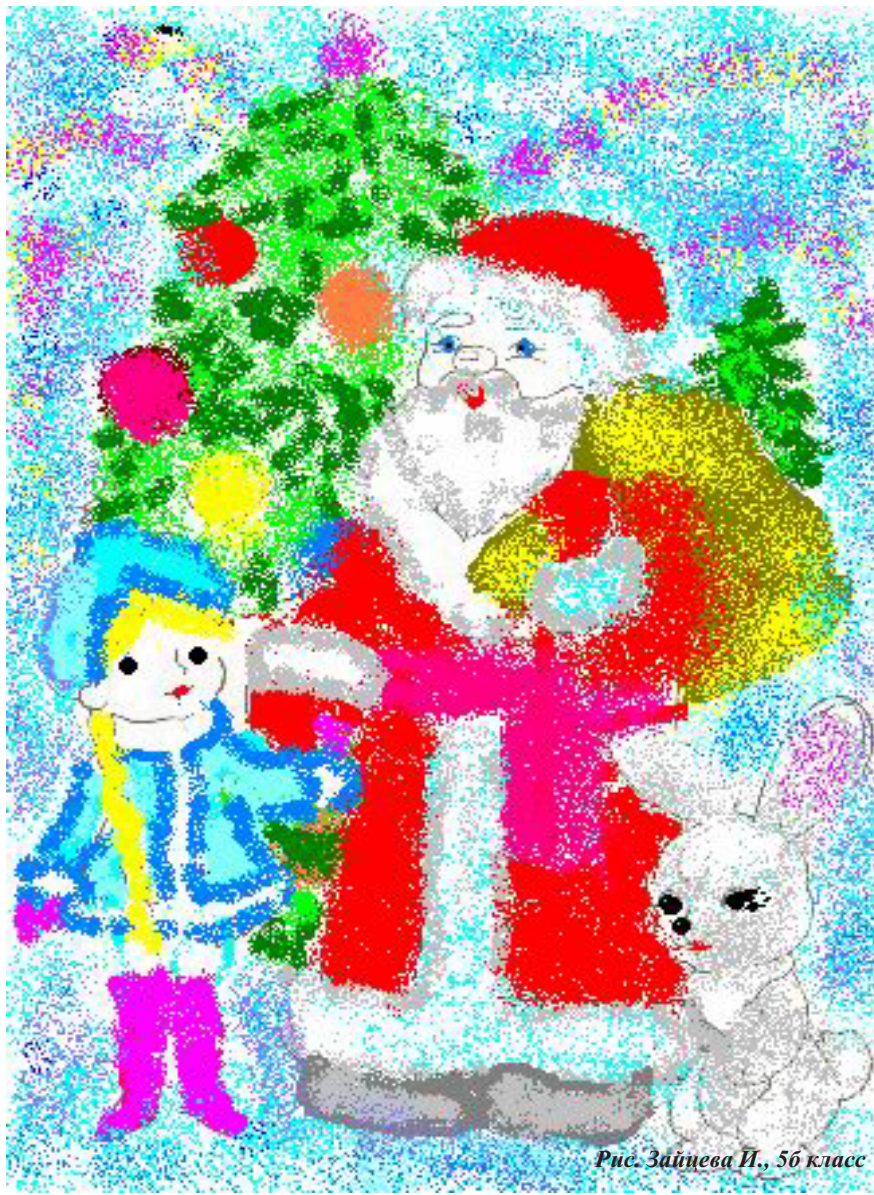
Рис. Зайцева И., 5б класс