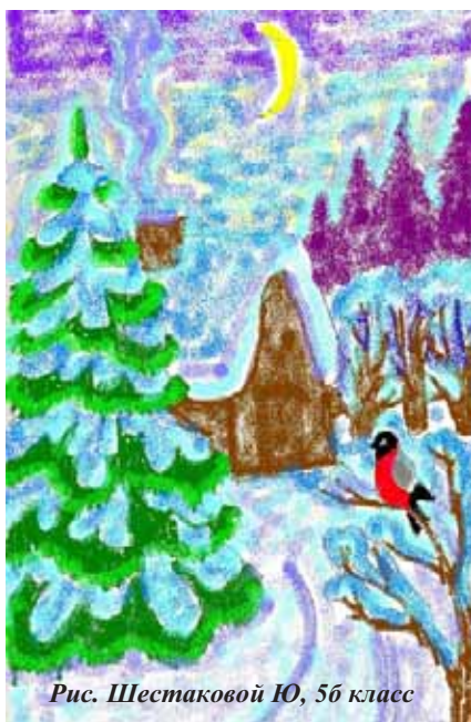
Рис. Шестаковой Ю., 5б класс

Идёт по лесу Настенька, плачет. Встретился ей Мороз. Жалко ему Настеньку, знал ее усердие да трудолюбие, доброту да ласку, но всё равно придумал задание: найти волшебный ларец, который спрятан под елью.